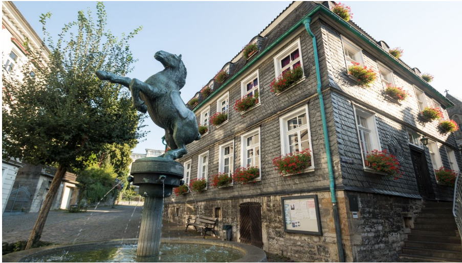
Pferdebrunnen und Stadtgeschichtshaus in Mettmann