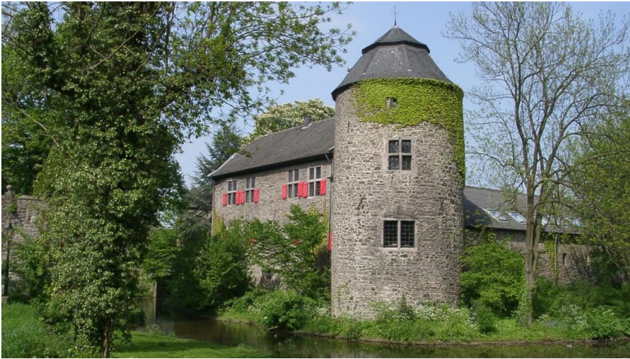
Wasserburg Haus zum Haus in Ratingen