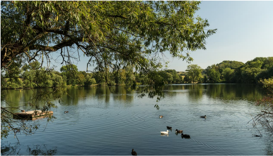
Abtskücher Teich der MuseumsLandschaft Abtsküche in Heiligenhaus