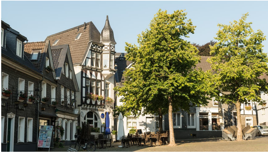
Kirchplatz der Oberstadt in Mettmann