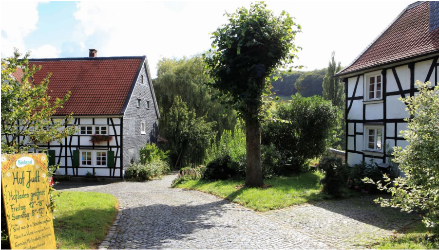
Einladender Hofladen auf dem Biohof Judt im Windrather Tal