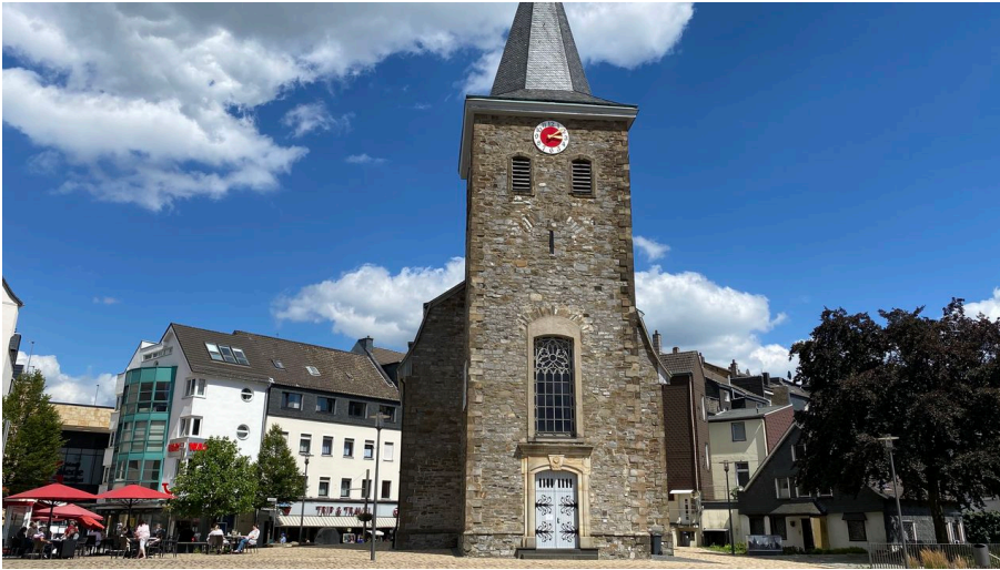
Alte Kirche in Velbert