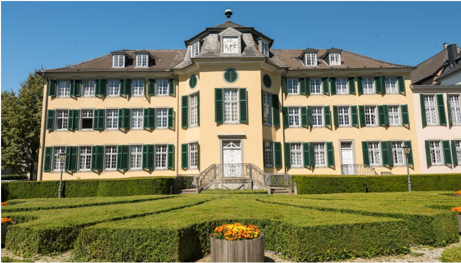
LVR-Industriemuseum Textilfabrik Cromford in Ratingen