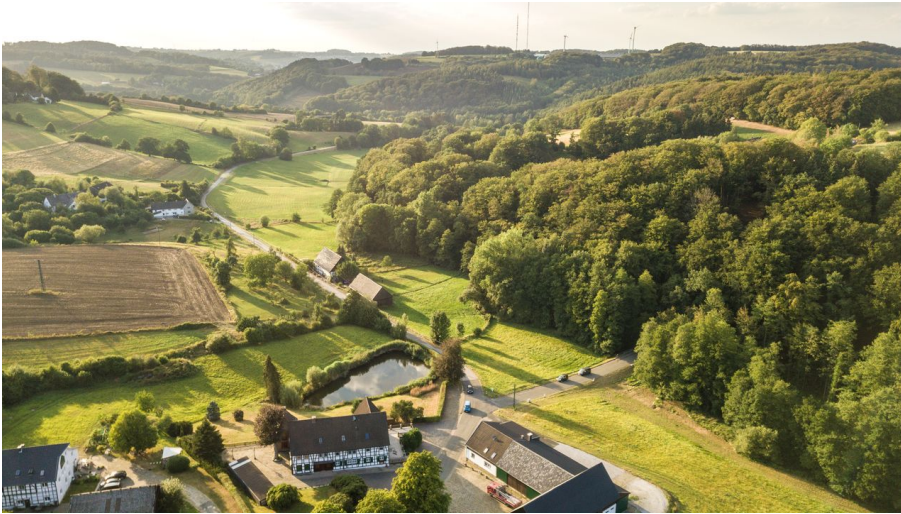
Windrath Tal bei Velbert