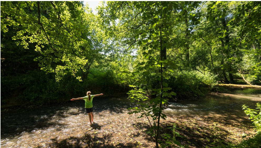
Erfrischung an der Düssel

Bus: Düsseldorf mit der Linie 641 bis Haan-Gruiten, direkt zur S-Bahn und zum P+R-Parkplatz