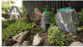
Mineralienpfad Gruiten