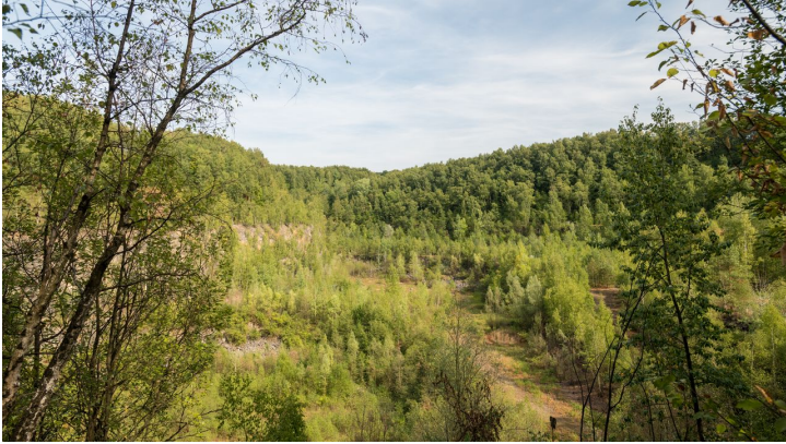
Entlang der Grube 7 bei Haan-Gruiten