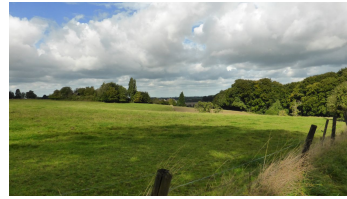
Vom Osterholz zum Düsseldorf