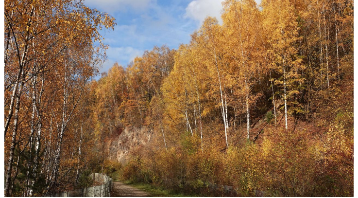
Herbstlicher Spaziergang entlang der Grube 7 bei Haan-Gruiten