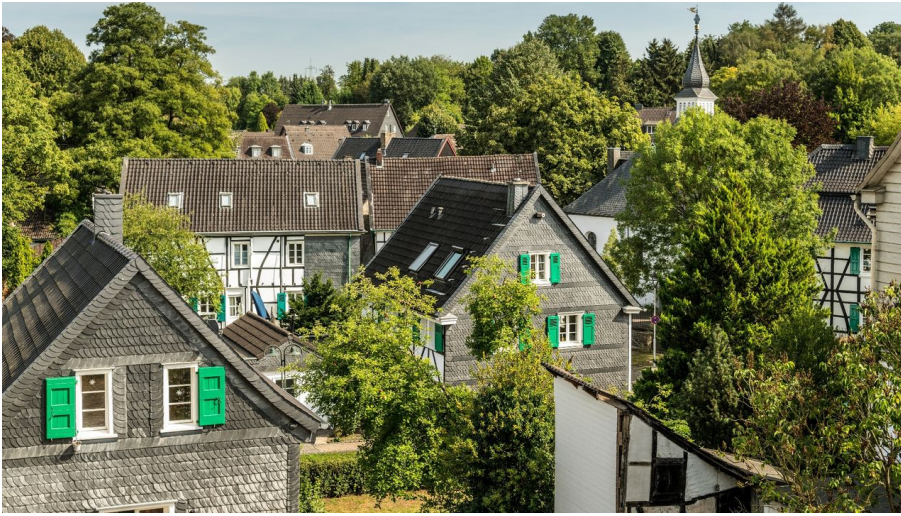
Aussicht auf Haan-Gruiten