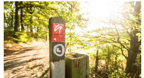
neanderland STEIG Wegmarkierung