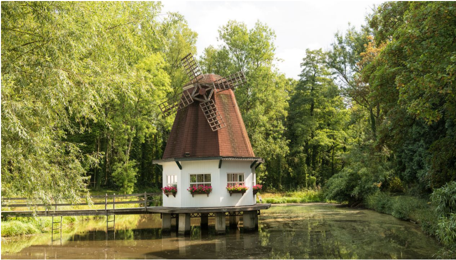
Heidberger Mühle im Ittertal bei Haan