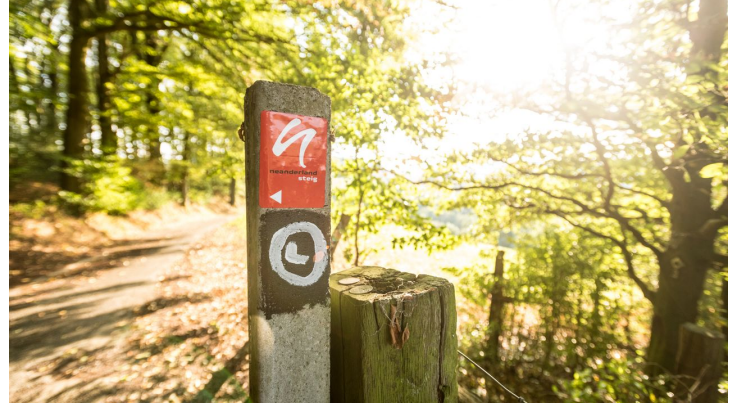
neanderland STEIG Wegmarkierung