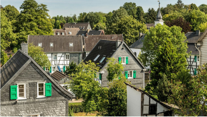
Aussicht auf Haan-Gruiten - © Dominik Ketz, Kreis Mettmann