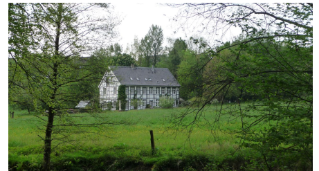
typischer Kotten im Ittertal, Brucherkotten