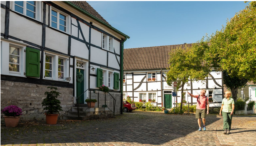
Besuch des Dorfes Gruiten

Zurück zum Start: Bahnhof Gruiten RE 48 nach Solingen Hauptbahnhof, dann Bus Linie 792 nach Haan Pütt