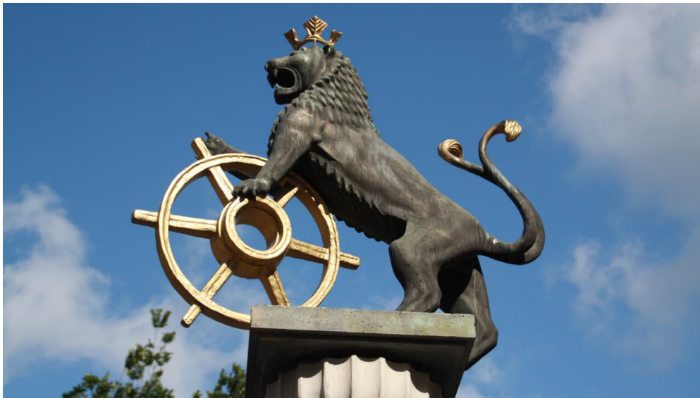
Abstecher zum Löwen-Brunnen auf dem Marktplatz in Ratingen

ab 07. September 2014 der im Droste - Verlag erscheinende Wanderführer mit Beiträgen von Manuel Andrack