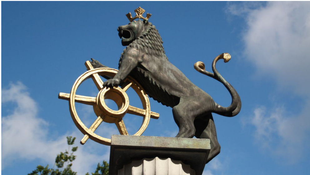
Abstecher zum Löwen-Brunnen auf dem Marktplatz in Ratingen

Zurück zum Start: Bus Ratingen Nösenberg Linie 752 nach Mülheim a.d. Ruhr Stooter Straße