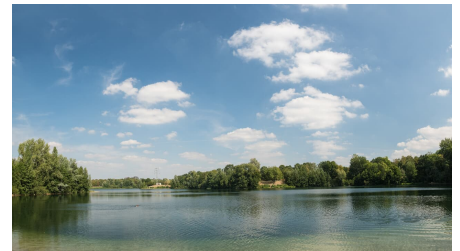
Silbersee und Grüne See im Erholungspark Volkardey in Ratingen