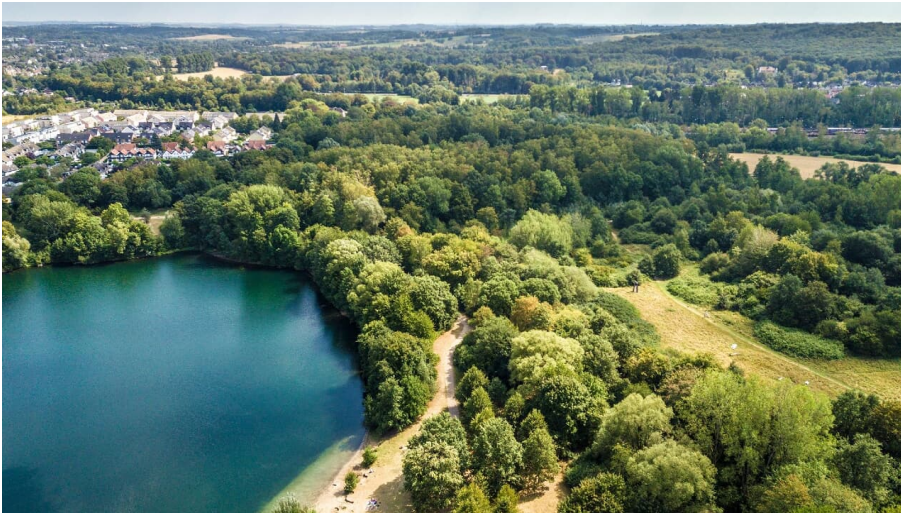
Blick auf den Silbersee und den Grünen See bei Ratingen