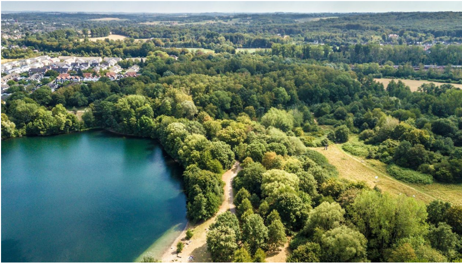
Blick auf den Silbersee und den Grünen See bei Ratingen