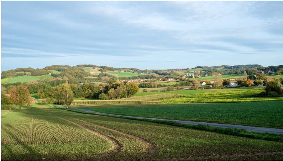
Ausblick Bonstapel