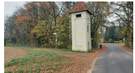
Auf Spurenuche in der Heidmark - Tour 5 rund um Schweimke