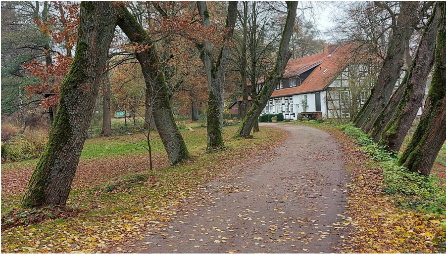
Auf Spurensuche in der Heidmark – Tour 5 rund um Schweimke