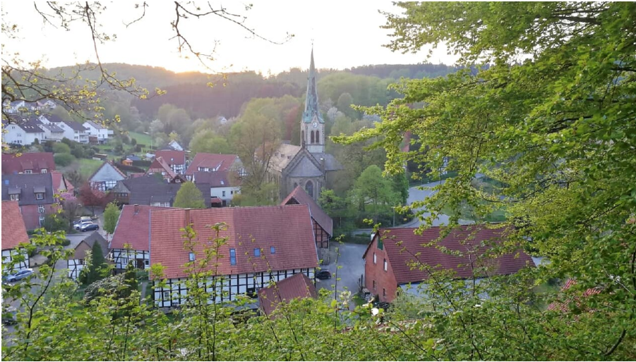
Blick auf Hillentrup