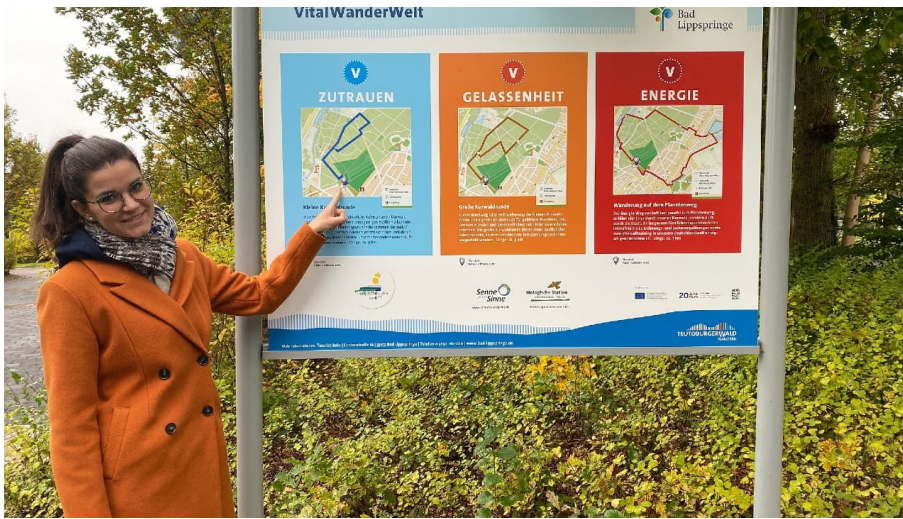
2021-10-22_Erlebbarer VitalWanderWelt im Heilwald.jpg