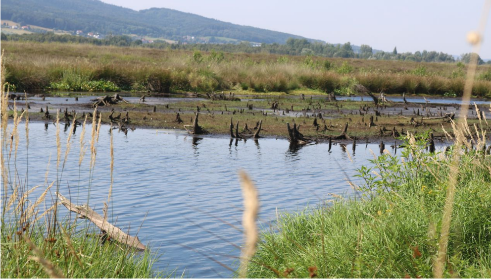
Lübecke_Großes Torfmoor_Lübecke Marketing - Kopie.JPG