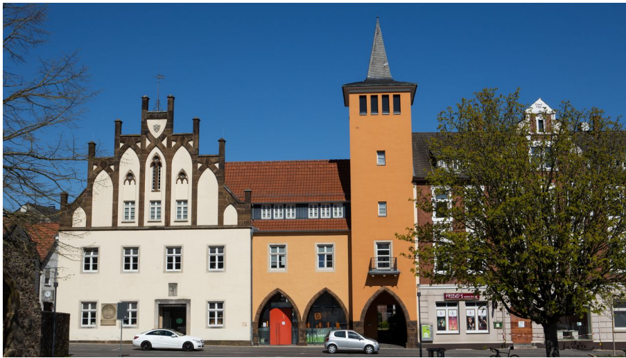
Lübbecke Altes Rathaus