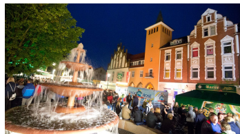
Lübecke_Bierbrunnenfest2_Oliver Krato.jpg