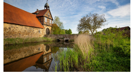
Gut Stockhausen