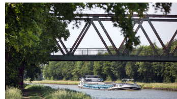
Lübecke Mittellandkanal Oliver Krato - © Oliver Krato