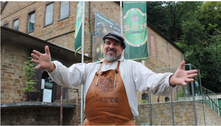
Barres Brauwelt.jpg