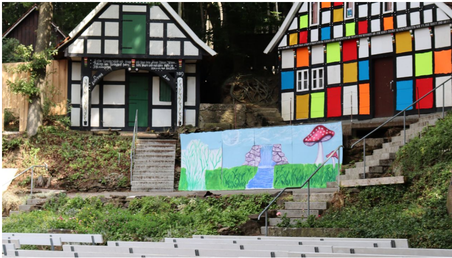
Kahle Wart.JPG