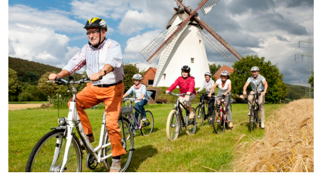
Windmühle Schnathorst