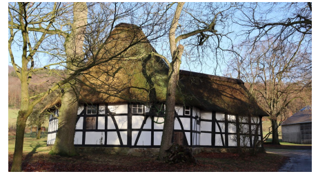
Rossmühle Oberbauerschaft.JPG