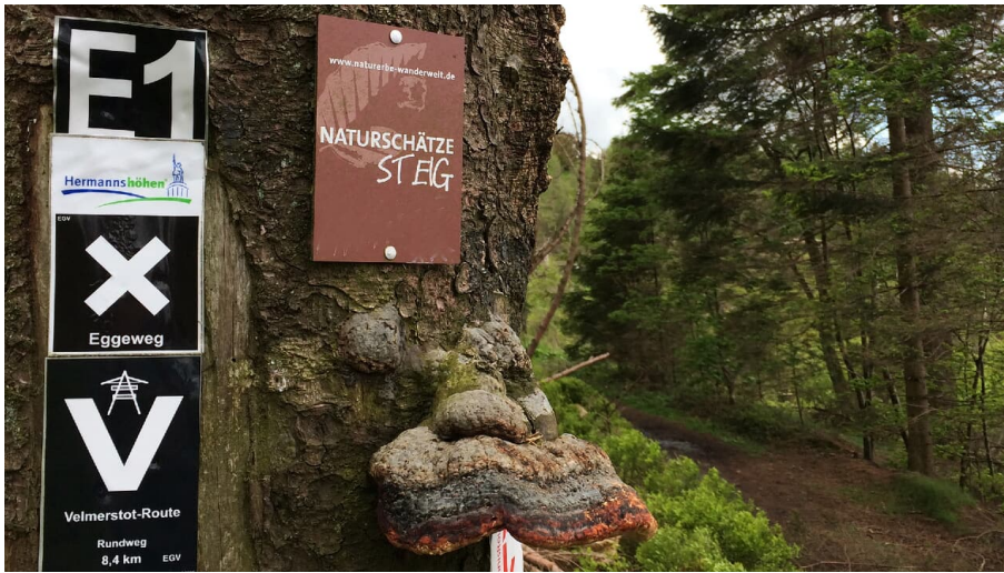
Naturerbe Wanderwelt Altenbeken | Naturschätze-Steig