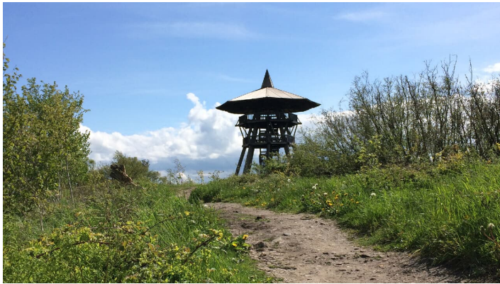
Naturerbe Wanderwelt Altenbeken | Naturschätze-Steig