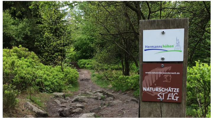
Naturerbe Wanderwelt Altenbeken | Naturschätze-Steig