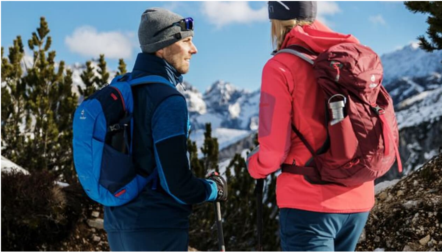
Schneeschuhwandern (2).jpg