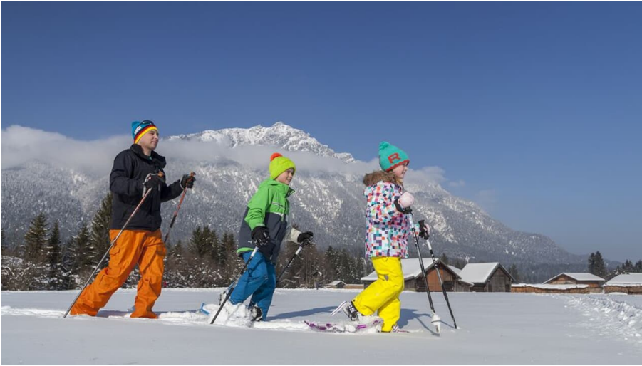
Schneeschuhwandern©Tourist Information Grainau –C Bäck (2).jpg - © Christian Bäck