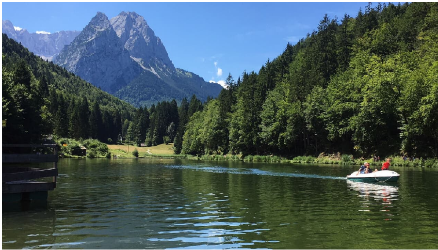
Riessersee Bild Petra IMG_0828.JPG