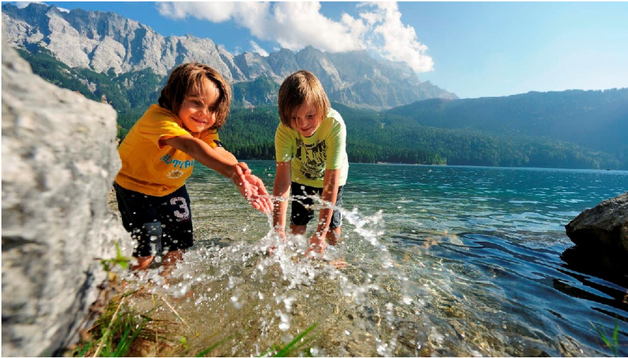
Badespass am Eibsee 1.jpg