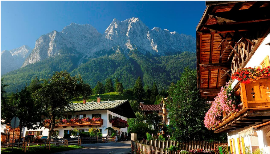
Grainau Dorfidylle.jpg