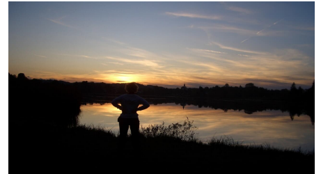
Fernwanderweg Meditationsweg Ammergauer Alpen - Soier See