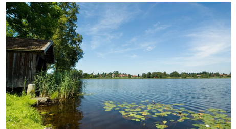
Soier See in Bad Bayersoien