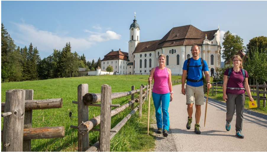
Start Meditationsweg an der Wieskirche