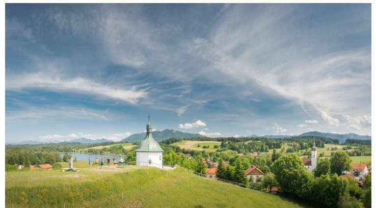
Kriegergedächtniskapelle in Bad Bayersoien