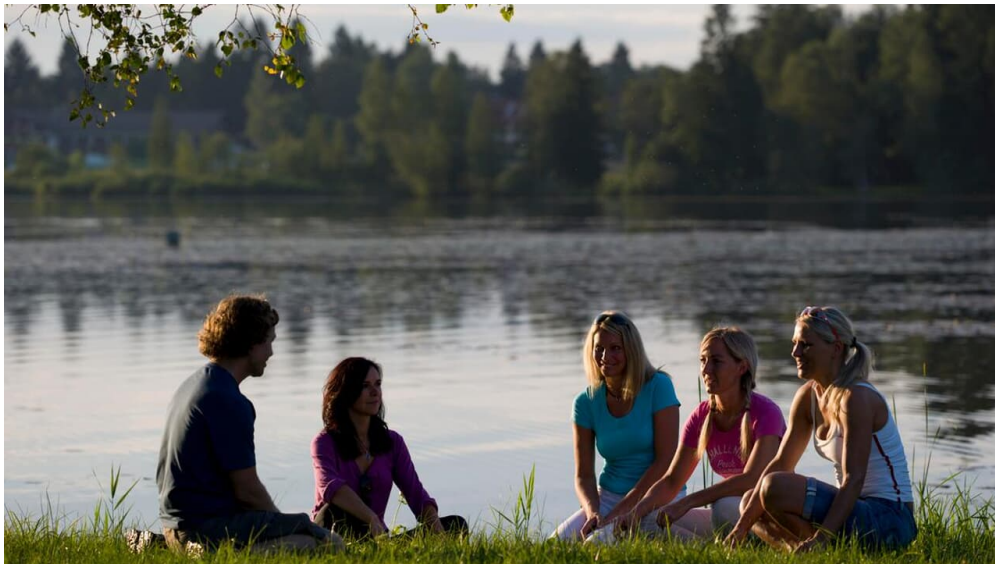
Fernwanderweg Meditationsweg Ammergauer Alpen - Soier See - © Thorsten Unsel, Ammergauer Alpen GmbH