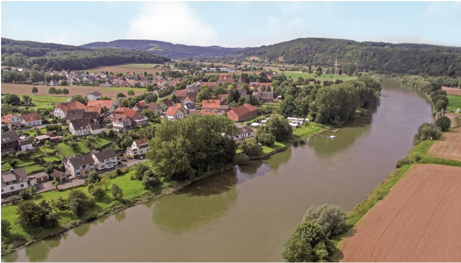
Weser CC BY-SA - Gemeinde Kalletal.tif