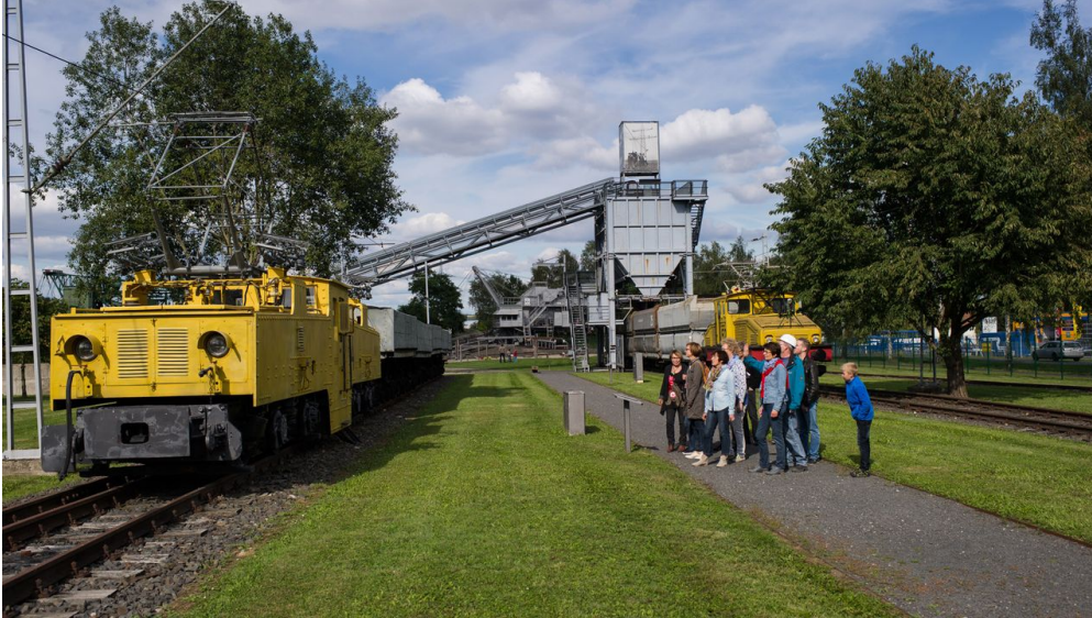
Bergbaumuseum Borken (hessen)