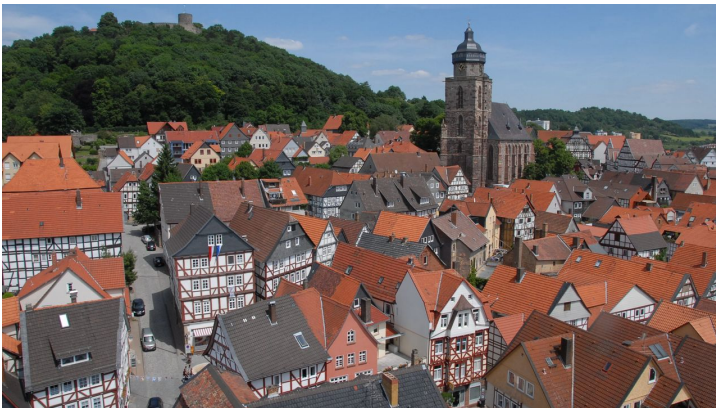
Homberg Stadtansicht