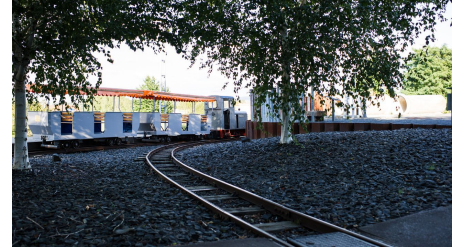
Bergbaumuseum Borken (Hessen)