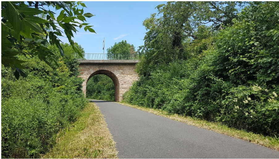
Bahnradweg Rotkäppchenland Brücke