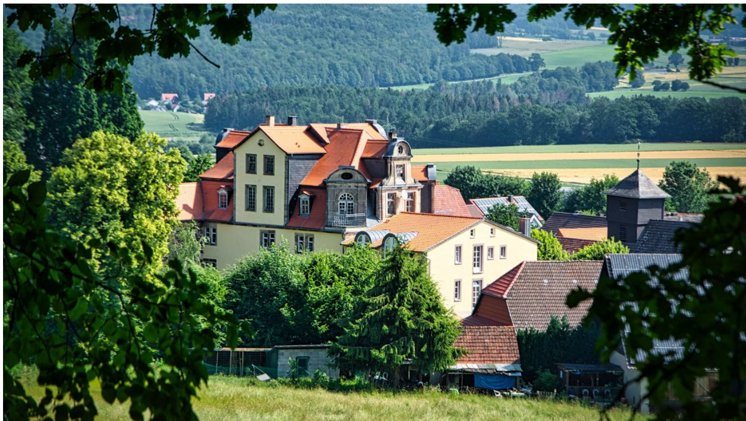
Blick auf das Schloss Riede