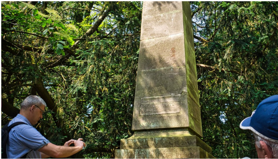
Obelisk im Waldpark Riede