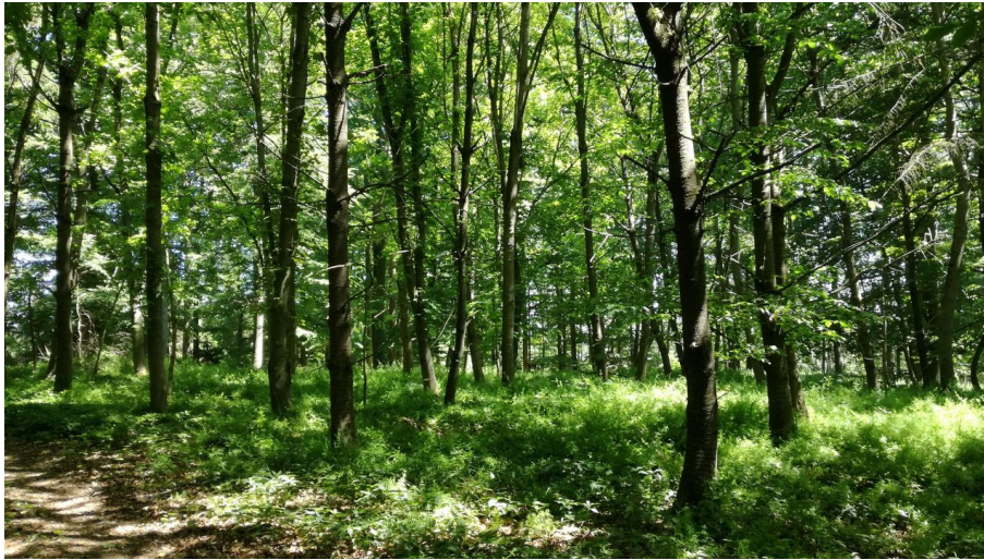
Wald bei Naumburg