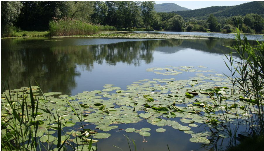
Bruchteiche am P7