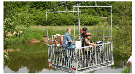
Fahrrad Seilbahn auf dem R1