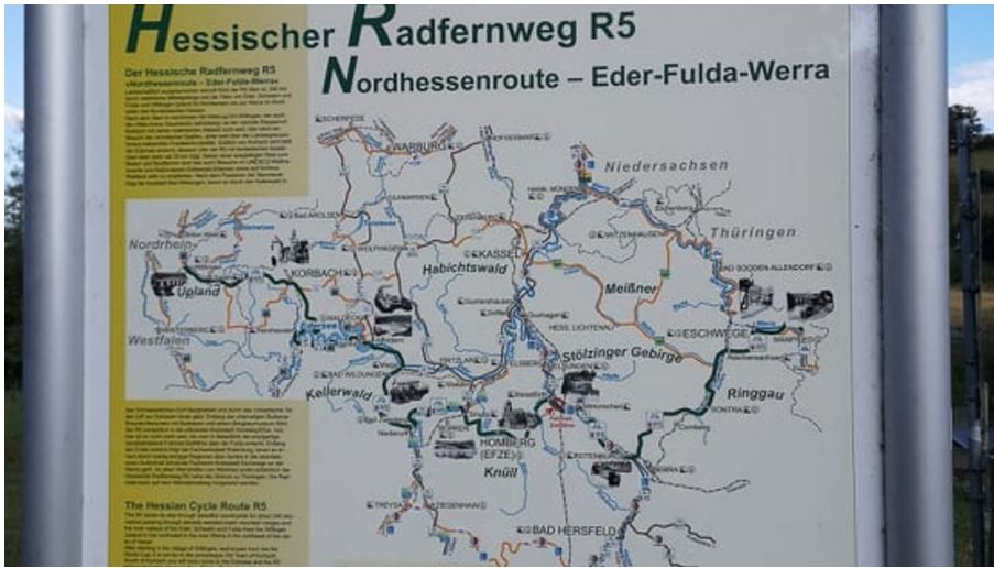
Hinweisschild R5 bei Fahrradseilbahn