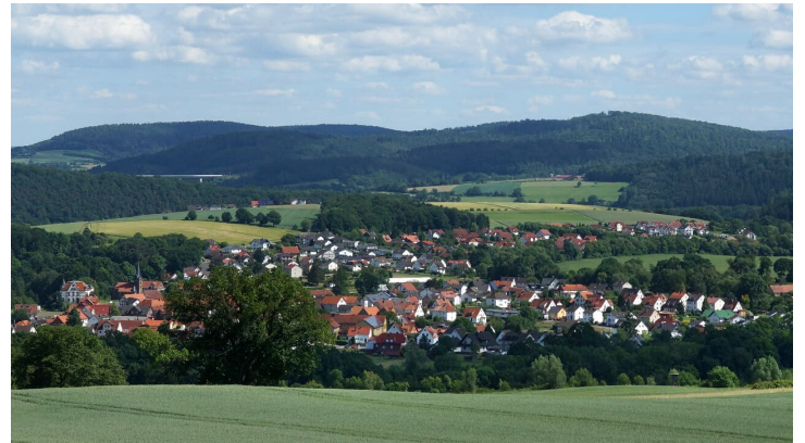
Panorama Malsfeld