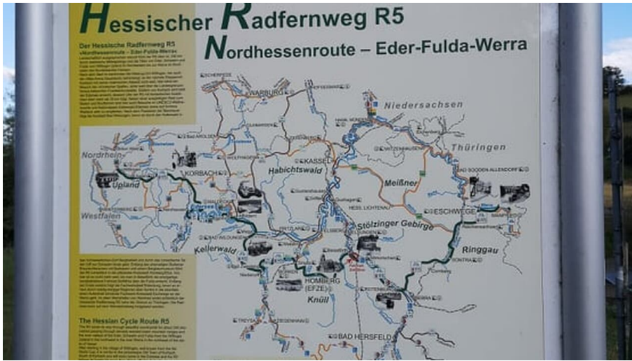
Hinweisschild R5 bei Fahrradseilbahn