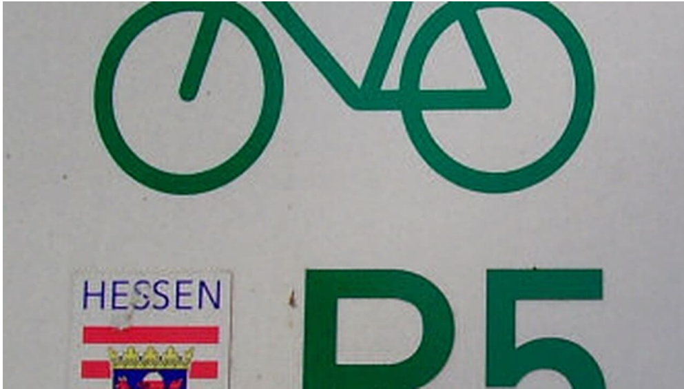
LOGO R5

Wanfried (Werra) oder Willingen (Upland)