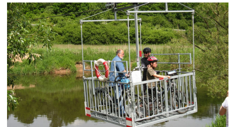
Fahrrad Seilbahn auf dem R1