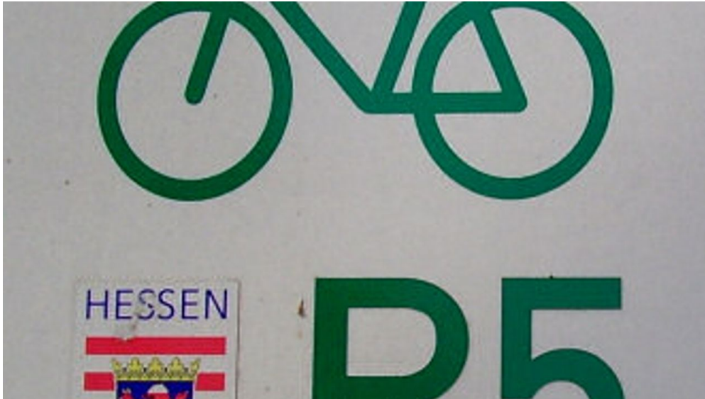
LOGO R5 - © toubiz, Astrid Laabs

Wanfried (Werra) oder Willingen (Upland)