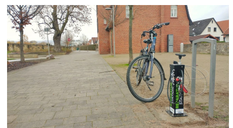
Die Fahrradreparaturstation im Lügder Emmerauenpark