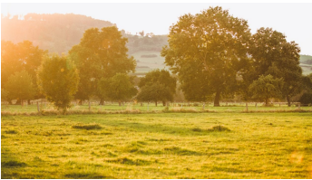
Sonnenuntergang Emmerwiesen - © Jessica Beuchler, Lügde Marketing e.V.