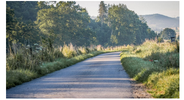
Sonnenaufgang Emmerwiesen