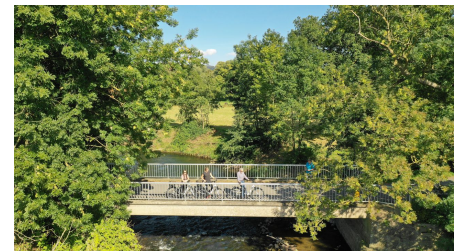
Emmerbrücke Bad Pyrmont - - info@badpyrmont.de