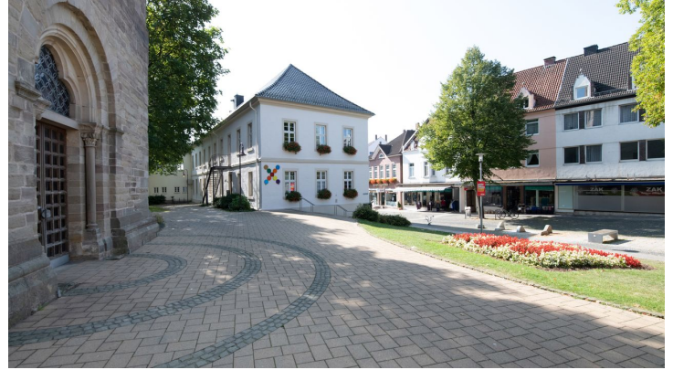
Kirchplatz und Fußgängerzone in Steinheim