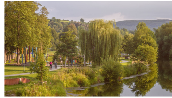
Blick auf den Emmerauenapark - - touristinfo@luegde.de