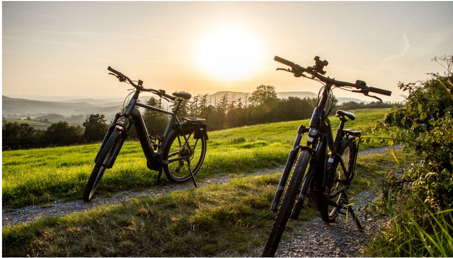
Radfahrer Lügde