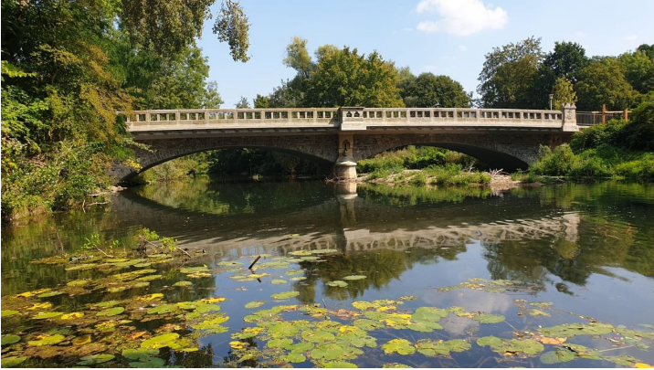
Emmerbrücke Bad Pyrmont