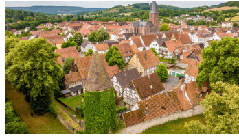
Lügde-Altstadt-Teutoburger-Wald-Tourismus- D.Ketz-009-Cc-BY-SA.jpg