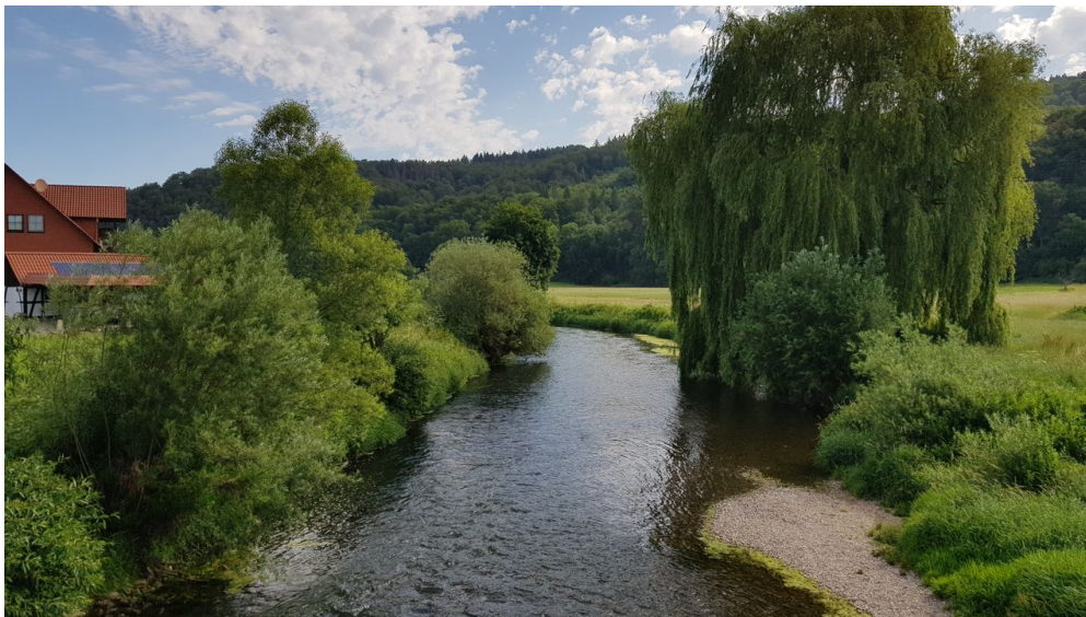
Blick auf die Emmer