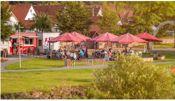
Café Ankerplatz im Emmerauenpark Lügde - © Edelweiß Fotografie, Jessica Beuchler