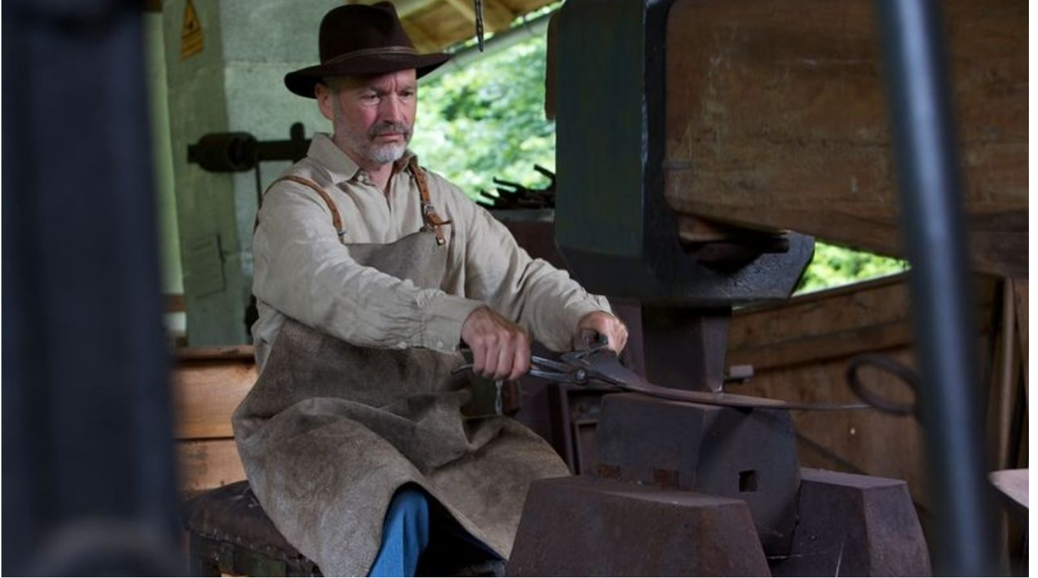
Der Königshammer in Friedrichstal - © Ulrike Klumpp, Nationalparkregion Schwarzwald - Baiersbronn / Murgtal