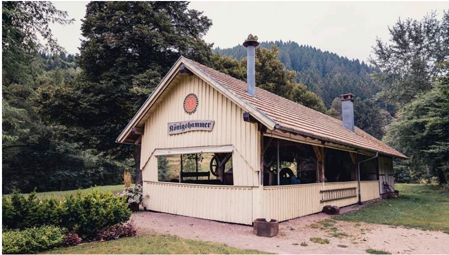
Der Königshammer mit Museum - © Stefan Kuhn Photography, Nationalparkregion Schwarzwald - Baiersbronn / Murgtal