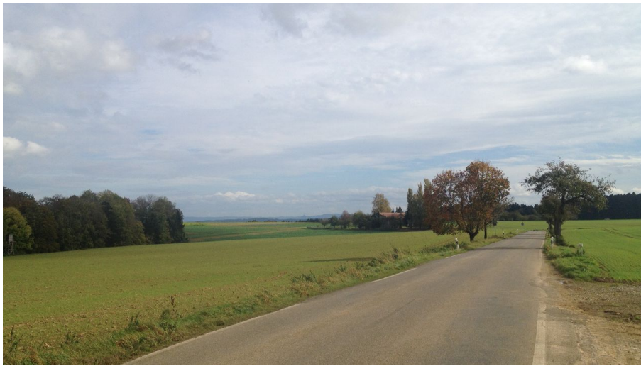
Blick auf Burg Hohenzollern