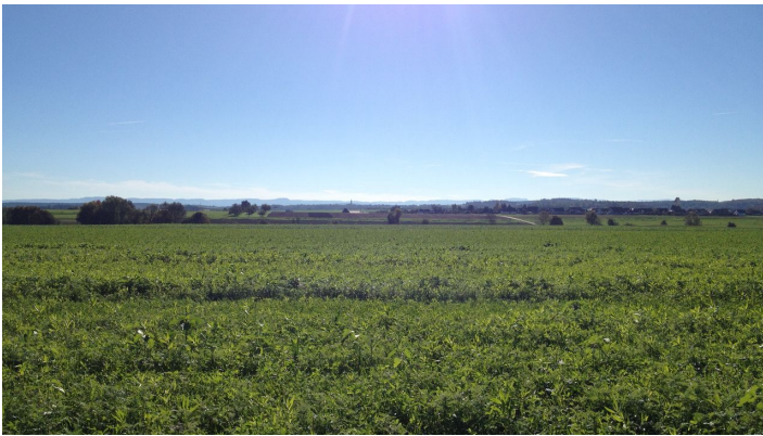
Blick auf die Schwäbische Alb