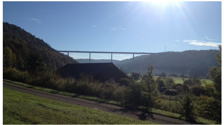
Neckartalbrücke A81