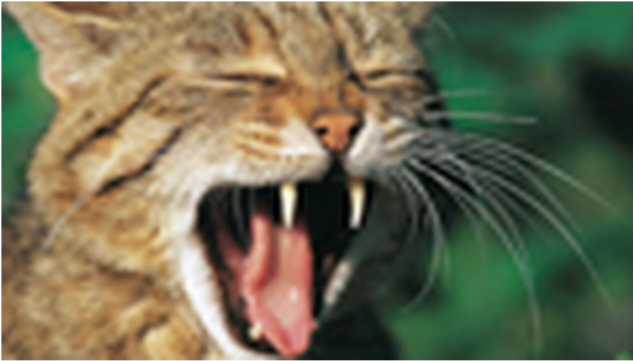
Wildkatzenpfad - © Christiane Paff, Thomas Stephan BUND, THOMAS_STEPHAN