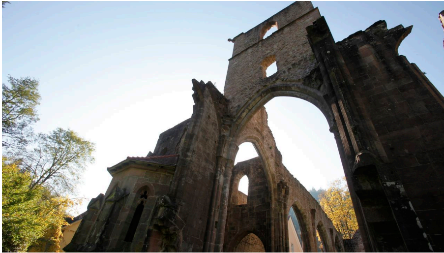
Klosterruine Allerheiligen