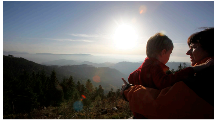
Aussichtsplattform am Schlifflopf