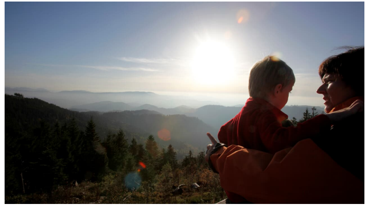
Aussichtsplattform am Schlifflopf