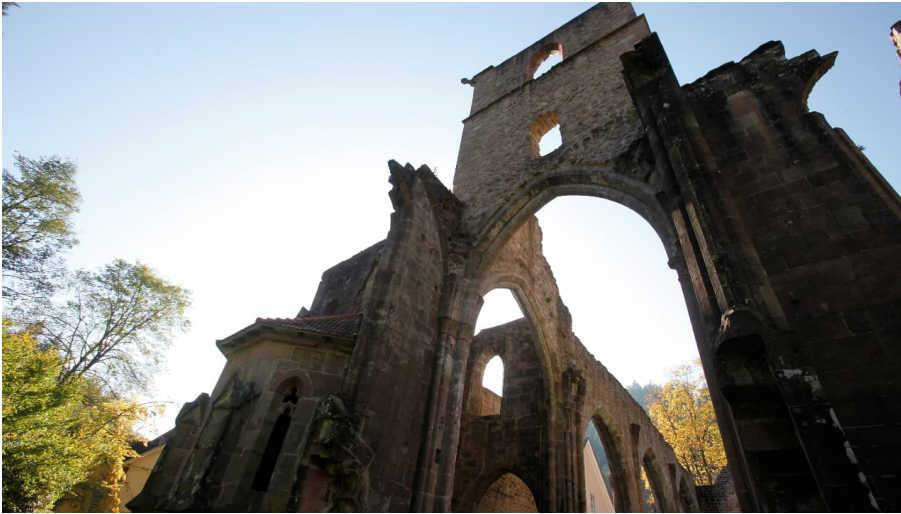
Klosterruine Allerheiligen