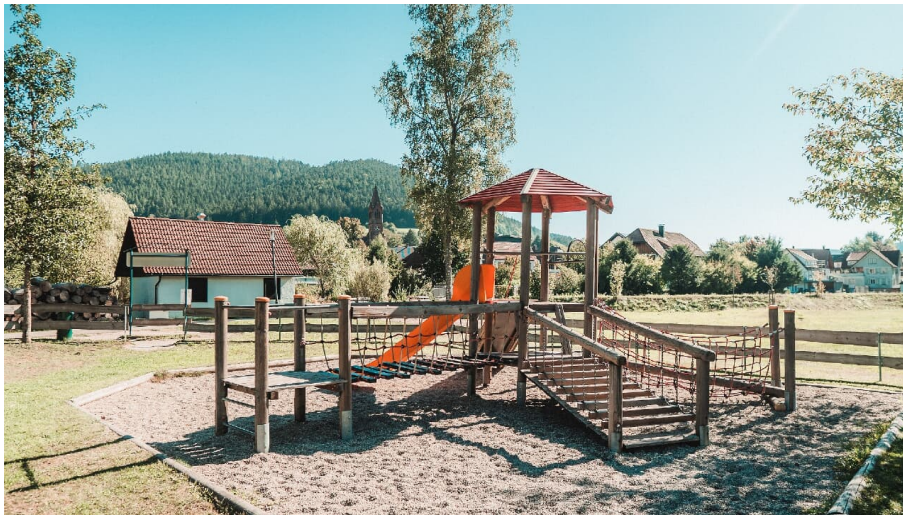
Spielplatz Mitteltal - © Max Günter, Nationalparkregion Schwarzwald - Baiersbronn / Murgtal