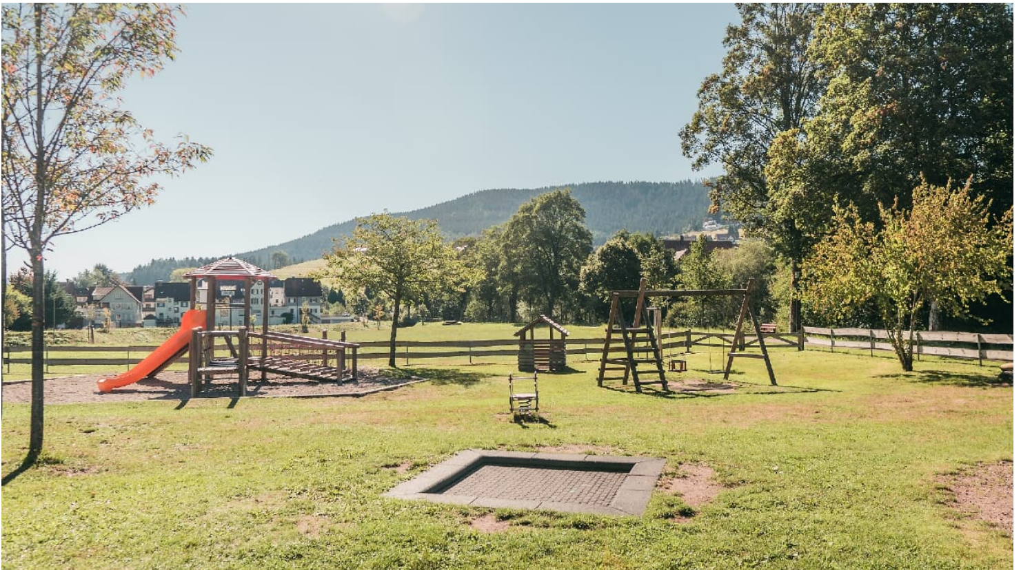
Spielplatz Mitteltal