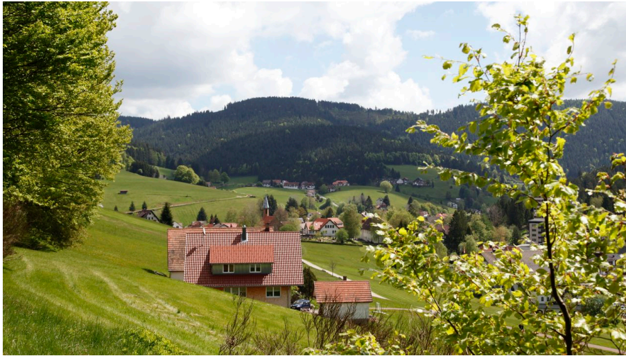
Obertal Buhlbach