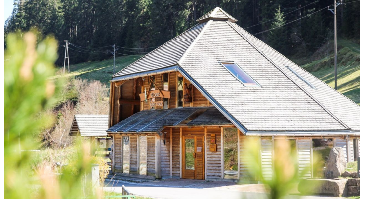
Wald-Kulturhaus - © Josef Oehler, Nationalparkregion Schwarzwald - Wolfstal