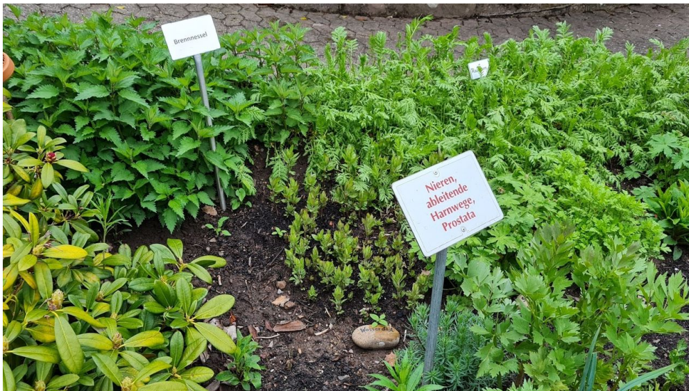
Rippoldsauer Kräutergarten - © Josef Oehler, Nationalparkregion Schwarzwald - Wolfstal

Die ideale Wanderzeit ist von Mai - Oktober