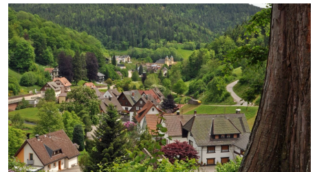
Ortsteil Bad Rippoldsau - © Josef Oehler, Nationalparkregion Schwarzwald - Wolfstal