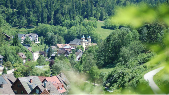
Ortsteil Bad Rippoldsau - Wolfstal