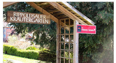
Eingang Rippoldsauer Kräutergarten