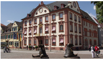
Historisches Rathaus Offenburg - © Tanja Keck, Stadt Offenburg