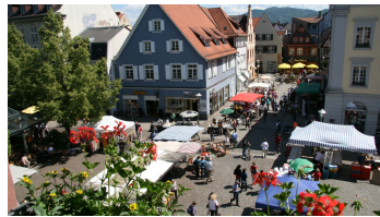
Innenstadt Offenburg