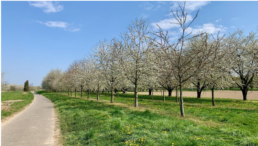
Nadine Fund, Nationalparkregion Schwarzwald - Renchtal/Durbach