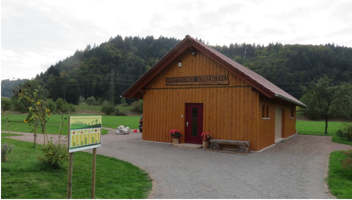
Imkerhaus - © Carolin Heymann, Schwarzwald