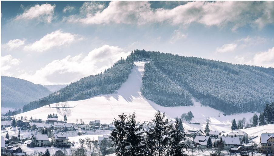
Winterlandschaft in Baiersbronn