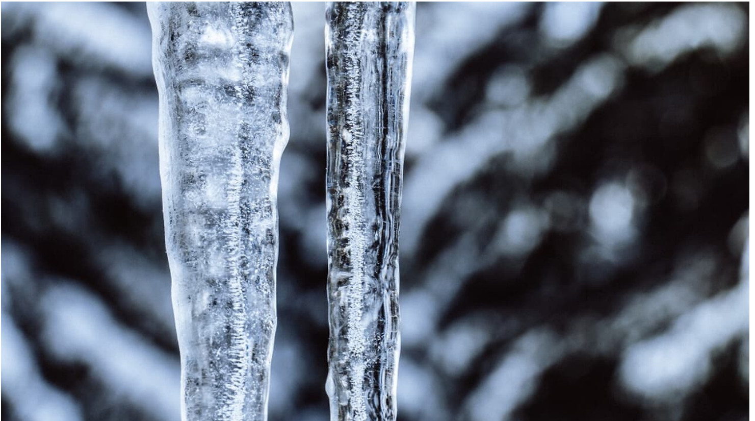
Eiszapfen im Wald