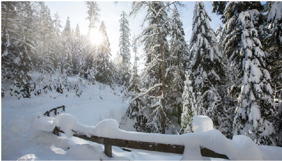
Winterlandschaft im Baiersbronn - © Ulrike Klumpp, Nationalparkregion Schwarzwald - Baiersbronn / Murgtal