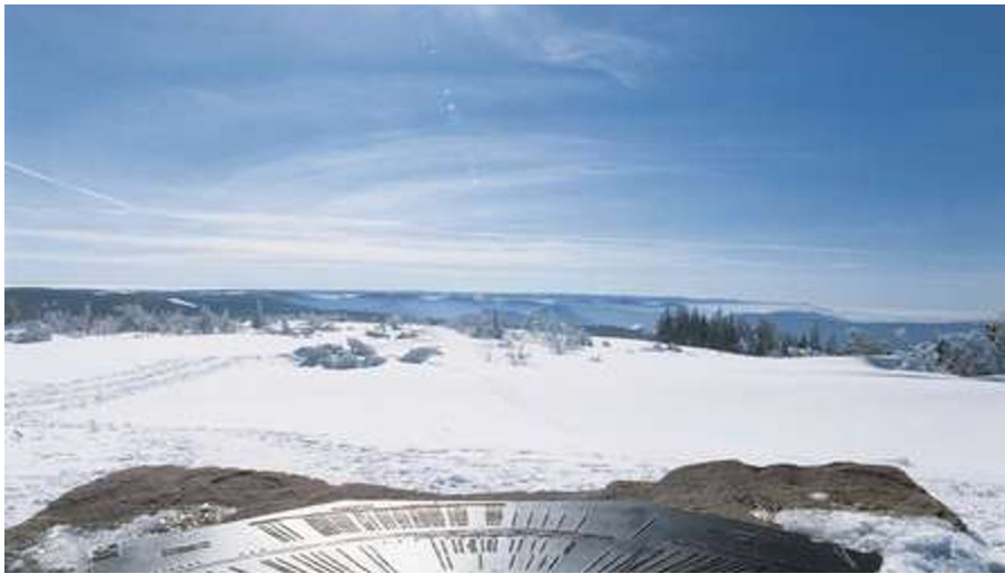
Blick vom Schliffkopf