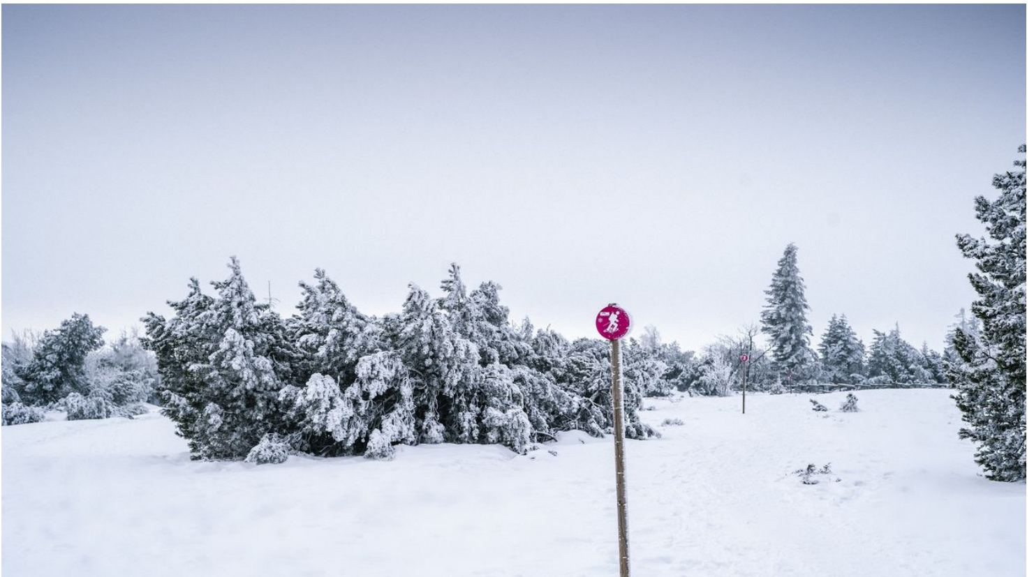
Schneeschuhtour vom Ruhestein zum Schliffkopf