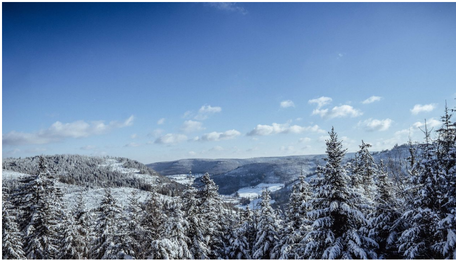
Winter in Baiersbronn - © Max Günter, Nationalparkregion Schwarzwald - Baiersbronn / Murgtal