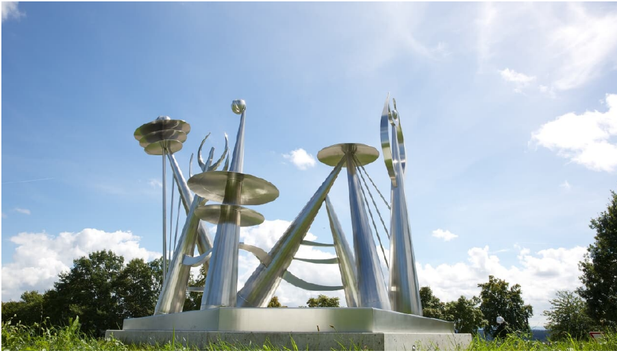
Skulptur Margot Jolanteh Hemberger