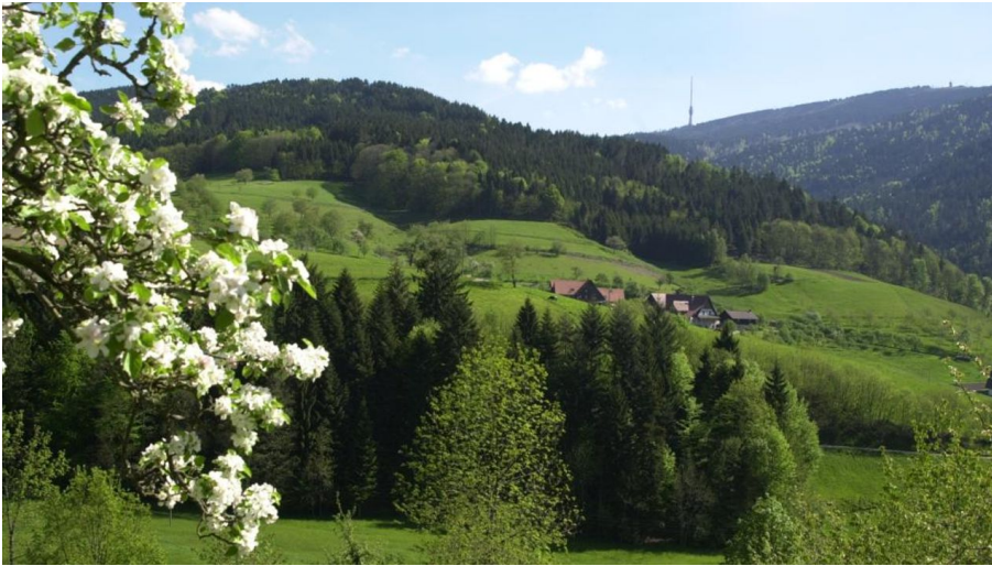
Blick zur Hornisgrinde