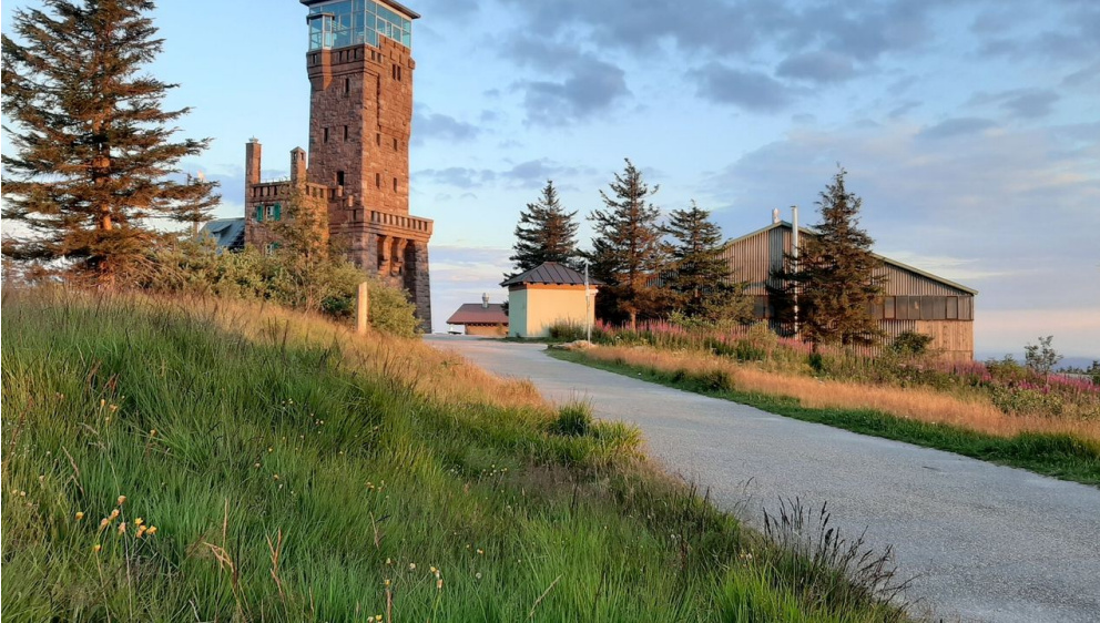
Blick zum Hornisgrinde-Aussichtsturm