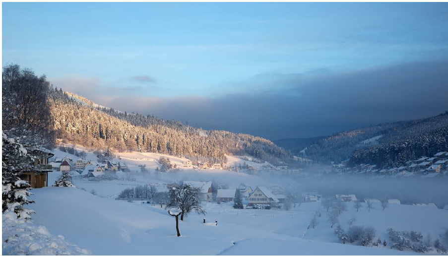
Tonbachtal im Winter