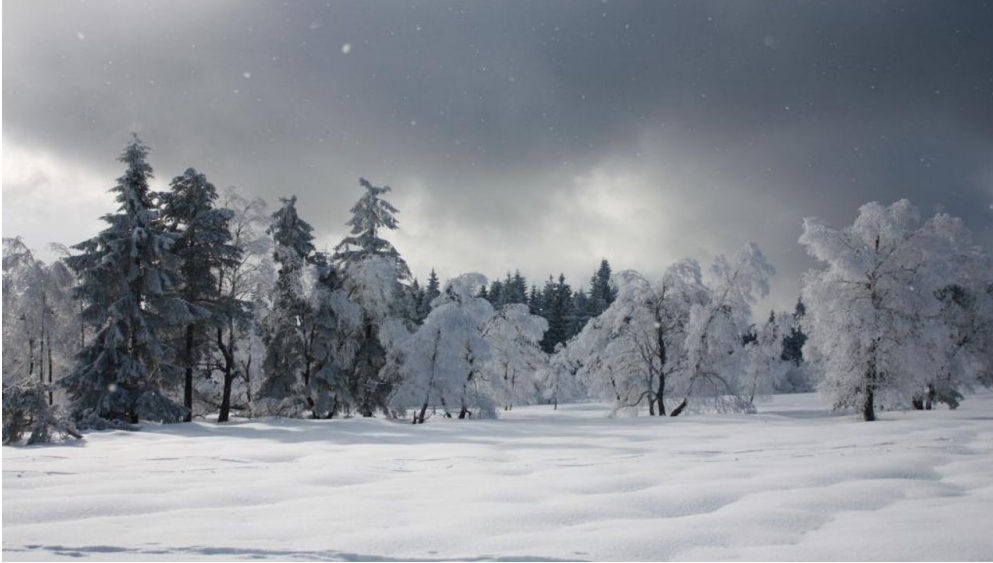
verschneite Landschaft