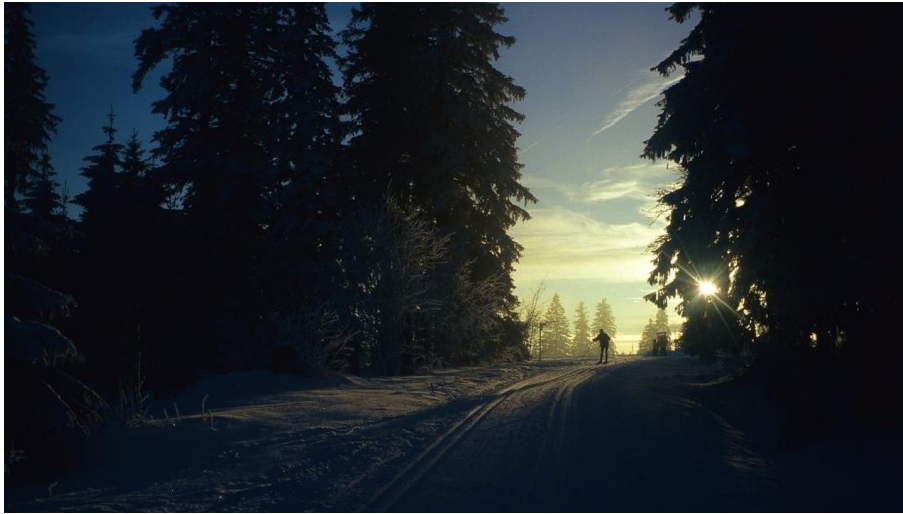
Nachtloipe in den frühen Morgenstunden