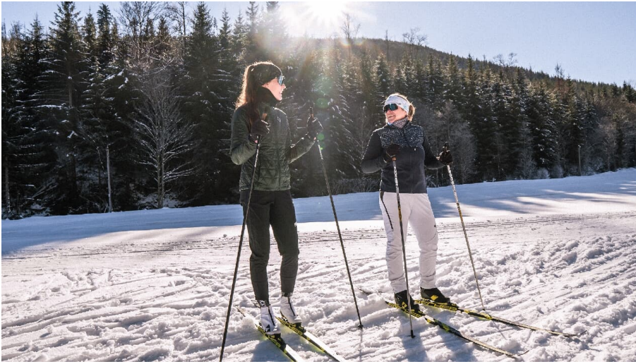
Verbindungsloipe zwischen Loipenzentrum und Schwimmbad - © Baiersbronn Touristik/ Max Günter, Nationalparkregion Schwarzwald - Baiersbronn / Murgtal